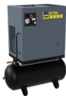
ULTRA 500-10-100 XVSBA