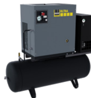
ULTRA 500-10-200 XVSXBDK ULTRA 900-10-200 XVSXBDK