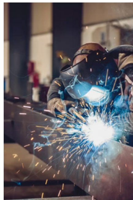
Malé mechanické zpracování