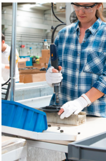
Montáž drobného zařízení