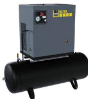
ULTRA 500-10-200 XVSBA ULTRA 900-10-200 XVSBA