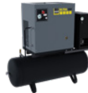
Schneider ULTRA kompresory