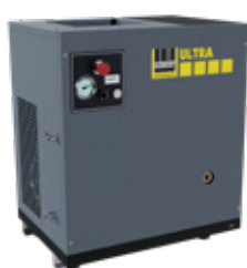
ULTRA 500-10 XVS ULTRA 900-10 XVS

** Hladina hluku měřena podle ISO 2151 2004